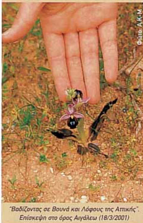
“Βαδίζοντας σε Βουνά και Λόφους της Αττικής”. Επίσκεψη στο όρος Αιγάλεω (18/3/2001)

από το επιθυμητό: ότι δηλαδή μου επιτρέπεται να αναγκάζω, ένα ζώο, να λειτουργεί με τους δικούς μου όρους. Ο ανθρωποκεντρισμός σε όλο του το μεγαλείο.