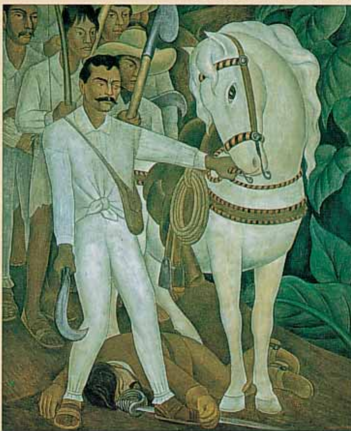
Diego Rivera, Agrarian Leader Zapata, 1931. Fresco, 79¼" x 6'2". The Museum of Modern Art, New York.

Αν και η μαρκησία επέπληξε τον πίθηκά της εμποδίζουσα αυτόν να δαγκάνη τοιοιτοτρόπως άλλοτε, ο βραχίον της υπηρετριάς ουχ ήπτον απεκόπη.