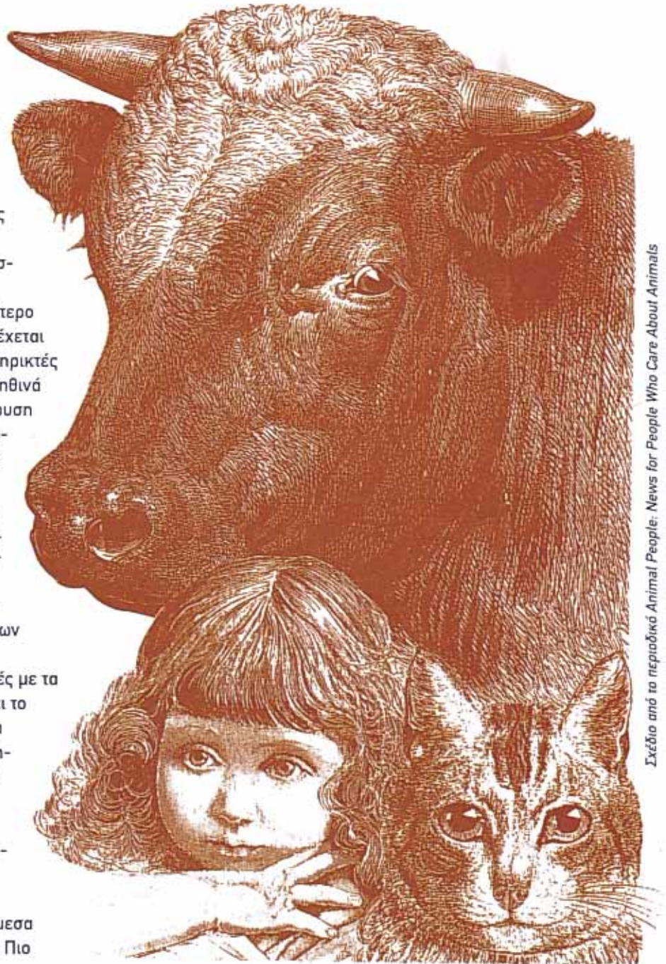
Σχέδιο από το περιοδικό Animal People: News for People Who Care About Animals

Ποιος θα περιθάψει τα αδέσποτα αν δεν έχει μάθει από μικρός να σέβεται τα ζώα μέσα από τη σχέση του με ένα γατί ή ένα σκυλί; Πιο