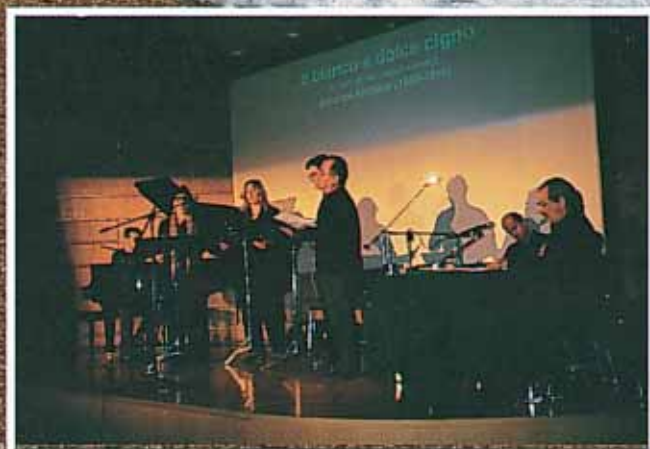
Στηγμιότυπο από τη βραδιά

Τριμηνιαία έκδοση των Φίλων του Μουσείου Γουλανδρή Φυσικής Ιστορίας