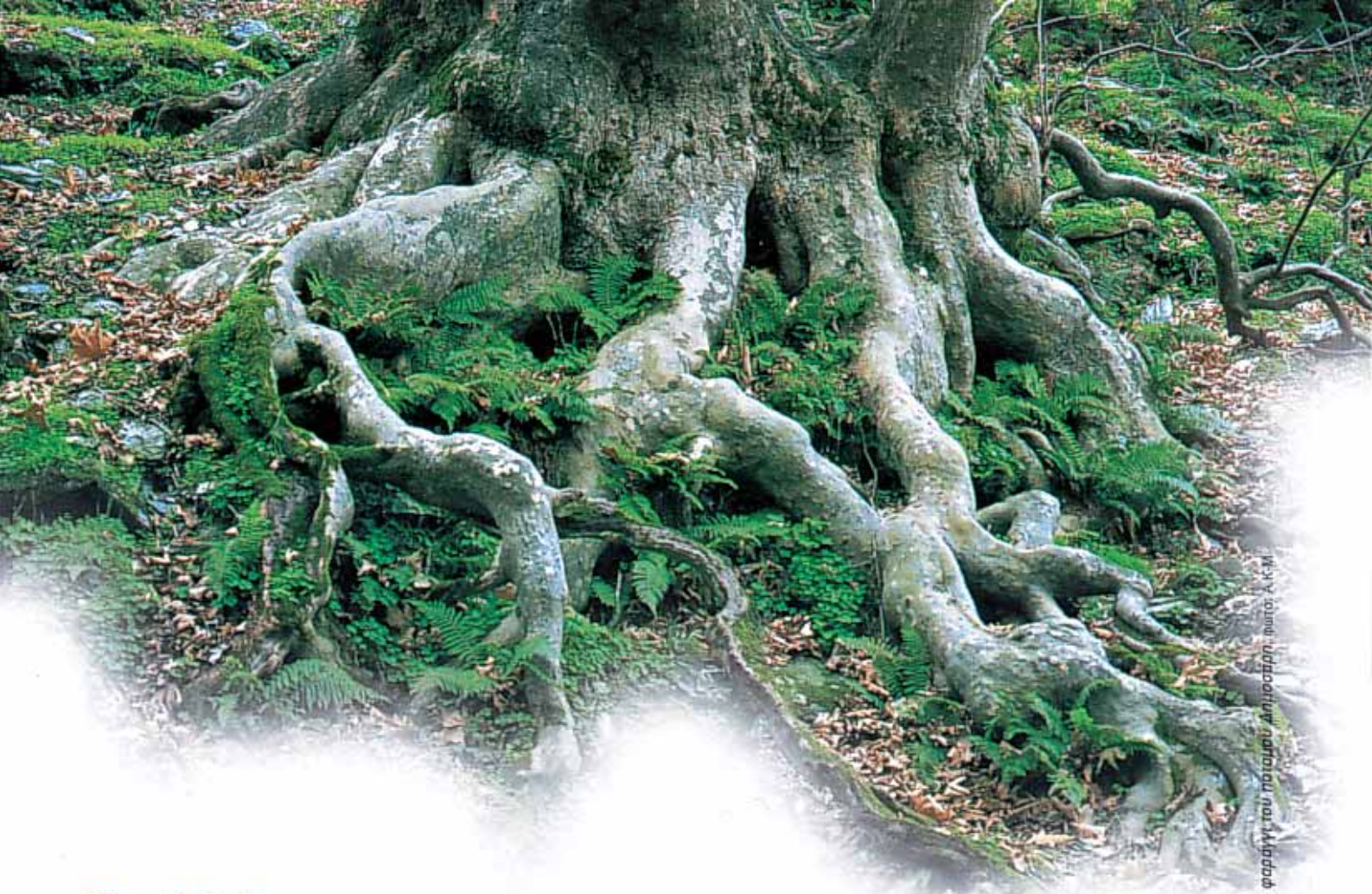
Εύβοια, φαράγγι του ποταμού Αμφοσπύρη, φωτο: Α.Κ.Μ.