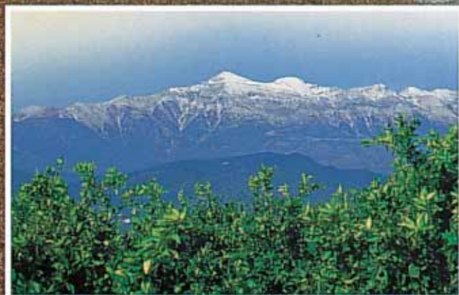
Το όρος Ταυγετος από την πεδιάδα της Λακωνίας

Σ υνεχίζοντας τη συμμετοχή τους στις εκδηλώσεις σύνδεσης πολιτισμού και περιβάλλοντος - και μετά τις «Οικολογικές Περιηγήσεις στην Ποίηση και στην Πεζογραφία» που είχαν γίνει το 1997 (βλέπε τεύχος 49) -, οι Φίλοι οργάνωσαν μια ακόμη βραδιά λόγου και μουσικής με θέμα «Τοπία και Ουτοπία». Η εκδήλωση πραγματοποιήθηκε στο αμφιθέατρο του Κέντρου ΓΑΙΑ στις 19 Νοεμβρίου του 2001. Τα πεζά και τα ποιήματα επιλέχθηκαν μετά από αρκετές συναντήσεις στην Ευώνυμο