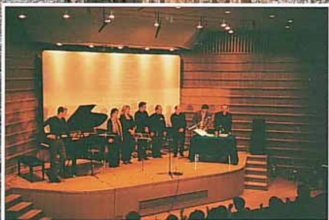
Στιγμιότυπο από τη βραδιά

Αντίθετα για τη δημοσίευση θελήσαμε να ταιριάξουμε ποιήματα και πεζά με εικόνες από την Ελλάδα, αφήνοντας τα τραγούδια χωρίς εικόνα, με ανάρτηση μελωδίας.