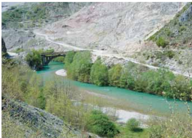
Κατακερματισμός του τοπίου στο φράγμα της Μεσοχώρας