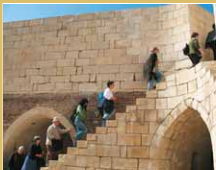
Στο φρούριο της Ροζέτης

Φθάνουμε στο φρούριο της Ροζέτης, όπου ανακαλύφθηκε η ομώνυμη στήλη, που έφερε κείμενο του Πτολεμαίου του Ε' γραμμένο σε τρεις γλώσσες, στα ιερογλυφικά, στη δημόδη αιγυπτιακή και στα ελληνικά. Από το κείμενο αυτό, το 1822 ο Γάλλος καθηγητής Σαμπολιόν αποκρυπτογράφησε την ιερογλυφική γραφή, κλειδί για την κατανόηση της αρχαίας Αιγυπτιακής