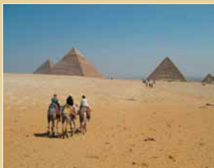
Η Βούλα, η Σοφία και η Νίκη πηγαίνοντας στις Πυραμίδες