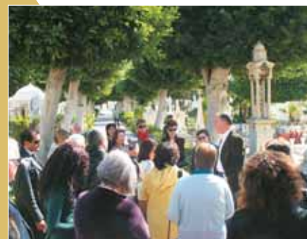
Στο ελληνικό κοιμητήριο της Αλεξάνδρειας