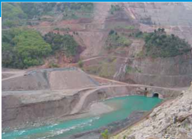
Κατακερματισμός του τοπίου στο φράγμα της Συκιάς