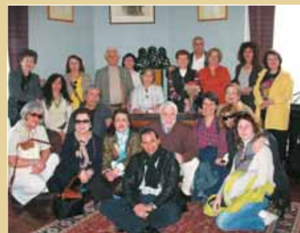
Στο Μουσείο Καβάφη