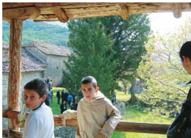
Αραγε σε ποιο τοπίο θα γιορτάζουν μεθαύριο τα παιδιά