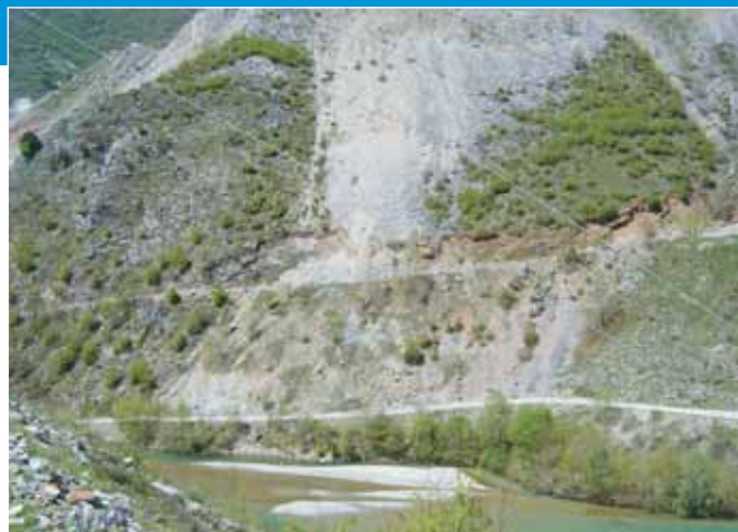
Έργα οδοποιίας στο φράγμα της Μεσοχώρας