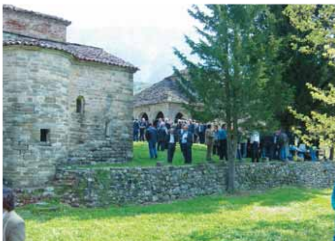
Εορτασμός Μονής Αγ. Γεωργίου στο Μυρόφυλλο