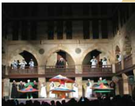
Οι περιστρεφόμενοι Δερβίσηδες στο Κάιρο

Στην εκκλησία του Αγίου Στέργιου επισκεπτόμαστε την κρύπτη στην οποία πιστεύεται ότι κατέφυγε η «Αγία Οικογένεια» κατά τη φυγή στην Αίγυπτο. Δεν παραλείπουμε μια επίσκεψη στο παλαιότερο και μεγαλύτερο Ελλη-