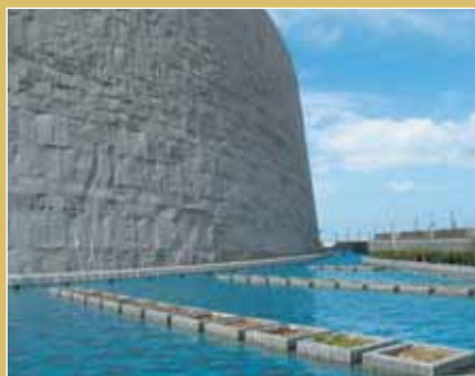
Άποψη της βιβλιοθήκης της Αλεξάνδρειας