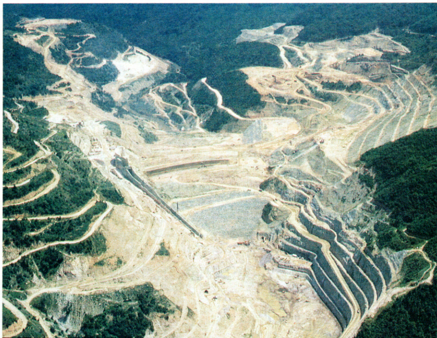
5. Το φράγμα του θησαυρού στο Νέστο: μεγιστοποίηση της τεχνικής παρέμβασης στο τοπίο.

Ο Νέστος, που πηγάζει στη Βουλγαρία, είναι από τους ωραιότερους ποταμούς της Βόρειας Ελλάδας. Η κοιλάδα και τα στενά είναι σημαντικοί βιότοποι για τα πουλιά. Το δέλτα του ποταμού αποτελεί υγρότοπο διεθνούς σημασίας (σύμφωνα με τη σύμβαση Ραμσάρ), ενώ το παραποτάμιο δάσος του Κοτζά Ορμάν (μικρό τμήμα του απέμεινε μετά τον εμφύλιο) είναι μοναδικό από οικολογική άποψη.