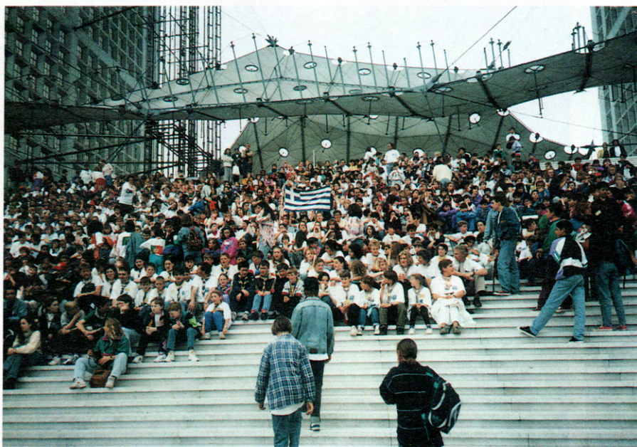
Αναμνηστική φωτογραφία 1992 παιδιά στην Arc de la Defense

Οι Σκωτσέζοι τραγούδησαν και χόρεψαν με πίπιζες για τον ποταμό τους τον Clyde, ο Δούναβης ζωγραφισμένος διέσχισε εξοχικές, δασωμένες και βιομηχανικές περιοχές, ο Τάμεσης με τη μορφή μιας μπλε κορδέλας ξεδιπλωνόταν ανάμεσα σε κάστρα και παλιές γέφυρες, ο Σηκουάνας, παρουσιάστηκε μ' ένα ποταμόπλοιο που στα κατάρτια του ανέμιζαν όλες οι σημαίες της Ευρώπης! Δίπλα στα ξακουστά ποτάμια άλλα μικρότερα και άγνωστα! Παιδιά από την Κροατία μας μετέφεραν τους ήχους του ποταμού Μύθνα με διάφορα μουσικά όργανα φτιαγμένα από υλικά του ποταμού: ξύλο, καλάμια, βότσλα π.χ. Η ιστορία του μικρού σολωμού από τον ποταμό Skjern της Δανίας που σώζει τη μικρή σειρήνα από το θάνατο! Ο Turia από την Ισπανία που δεν ανταμώνει ποτέ τη θάλασσα γιατί όταν φθάνει στην πόλη εγκλωβίζεται σ' ένα αγωγό διυλιστηρίου!