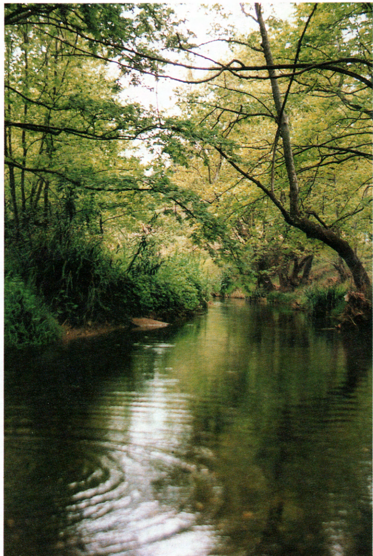
Ο Κηφισός κοντά στις Αδάμες

Ο Δημήτρης Πικιώνης (1887-1968) ήταν πολιτικός μηχανικός, αρχιτέκτονας και ζωγράφος, καθηγητής του Πολυτεχνείου και Ακαδημαϊκός. Τα έργα του χαρακτηρίζονται από τον τονισμό των ελληνικών στοιχείων και το σεβασμό στο περιβάλλον.