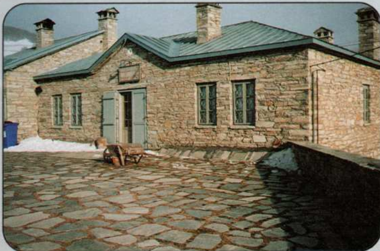
Ο κοινοτικός Ξενώνας Νυμφαίου που φιλοξένησε τη συνάντηση

Η Γενική Γραμματεία Νέας Γενιάς και η περιβαλλοντική οργάνωση ΑΡΚΤΟΥΡΟΣ με τη συνδρομή της Εθελ. Εργασίας Θεσ/νίκης και την υποστήριξη της Ευρωπαϊκής Επιτροπής, διοργάνωσαν συνάντηση στο Νυμφαίο του Νομού Φλώρινας. Το θέμα της συνάντησης ήταν "Εθελοντισμός και Φυσικό Περιβάλλον - Οργάνωση