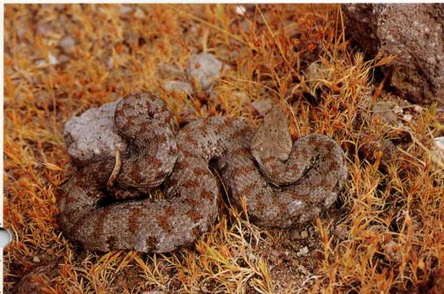
Η οχιά της Μήλου Macrovipera schweizeri (syn. Vipera lebetina )

Το 1996 ήταν για το Μουσείο έτος που σφραγίστηκε από την ασθένεια και το θάνατο του προέδρου του. Αν και μέχρι το καλοκαίρι ο Πρόεδρος ήταν παρών, από τους τελευταίους καλοκαιρινούς μήνες η απουσία του άρχισε να γίνεται αισθητή.