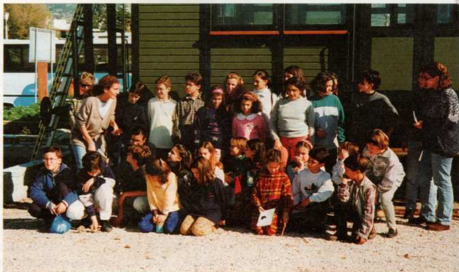
Στο κέντρο Διάσωσης θαλάσσιων Χελώνων (24/11/96).

• Στις 5 Ιουνίου , Παγκόσμια Ημέρα Περιβάλλοντος, στήσαμε το περίπτερό μας στο καινούριο Πάρκο Περιβαλλοντικής Ευαισθητοποίησης στους Αγίους Αναργύρους. Κρεμάσαμε τα πανό μας από την δραστηριότητα του 1995 για τα ΡΕΜΑΤΑ ΤΗΣ ΑΤΤΙΚΗΣ, απλώσαμε τα εφημεριδάκια μας και υποδεχθήκαμε τους επισκέ-