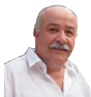
... από τον Θοδωρή Κοντάρη*

Από την ερημιά της αττικής γης, στη δημιουργία ενός σφριγηλού προσφυγικού προαστίου της Αθήνας.