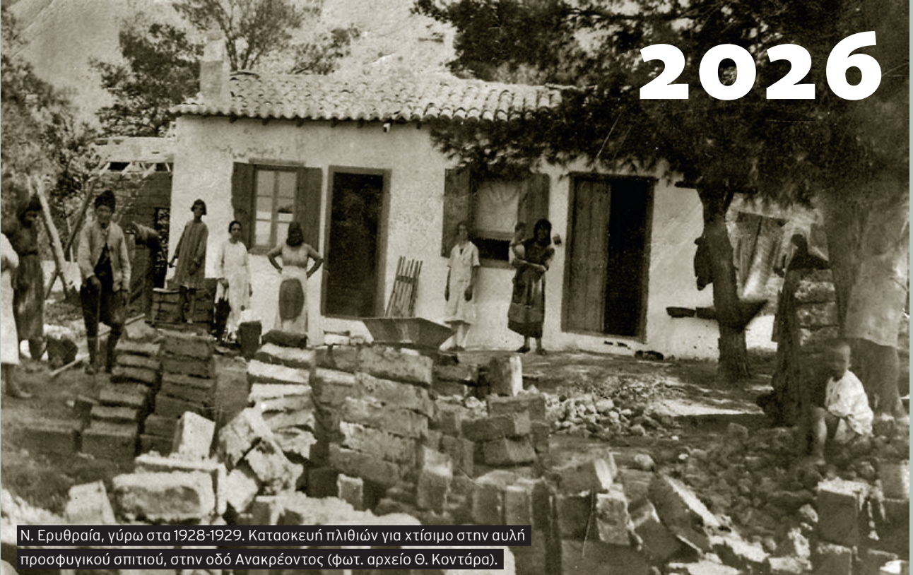
Ν. Ερυθραία, γύρω στα 1928-1929. Κατασκευή πλιθιών για χτίσιμο στην αυλή προσφυγικού σπιτιού, στην οδό Ανακρέοντος.